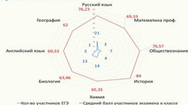
Результаты 11В класса